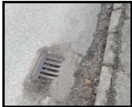
Kanaldeckel in Richtung Lumpfgraben