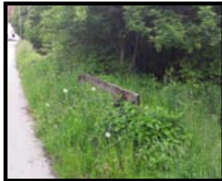
Rastbank in Richtung Hanusch